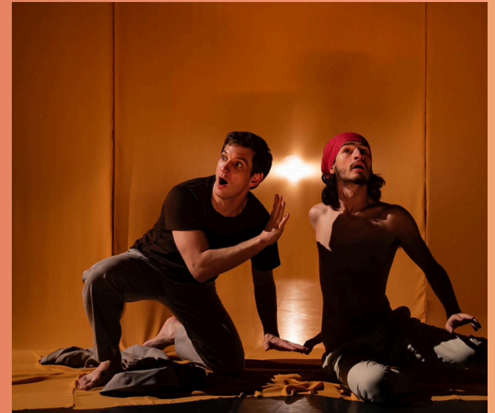
Le Lys et le Jasmin - Maison du Théâtre et de la Danse, Epinay-sur-seine, 2022