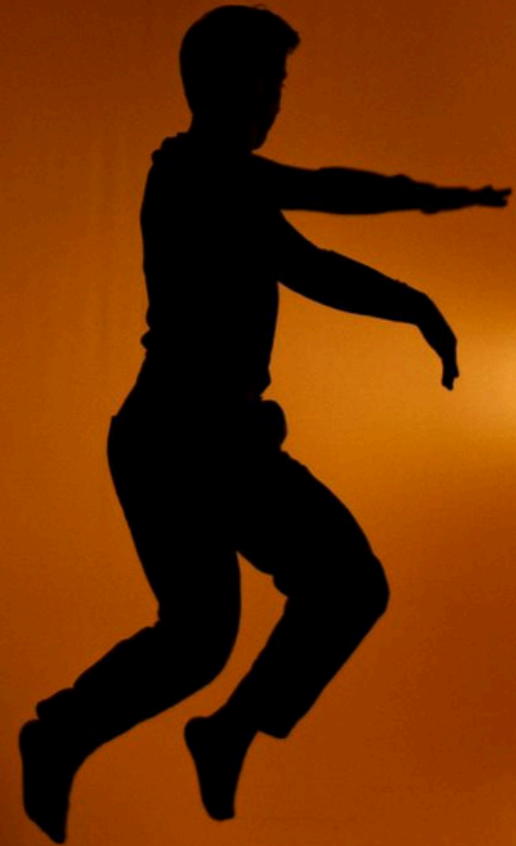
Le Lys et le Jasmin - Maison du Théâtre et de la Danse, Epinay-sur-seine, 2022

Le spectacle se joue au Théâtre des Barriques pendant le Festival d'Avignon Off 2024, puis au Théâtre du Chariot à Paris à l'hiver 2025.