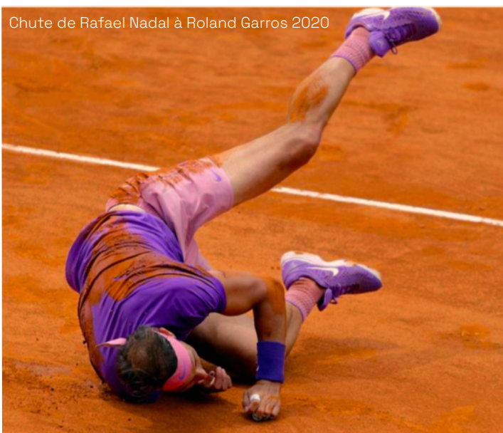
Chute de Rafael Nadal à Roland Garros 2020

Les comédiens dessinent et modèlent l'espace au fur et à mesure du spectacle. Par exemple, Ellen, suite à un différent avec Nathan, vient faire apparaître la ligne de milieu de terrain : alors qu'ils étaient dans un même espace, ils s'affrontent désormais face à face.