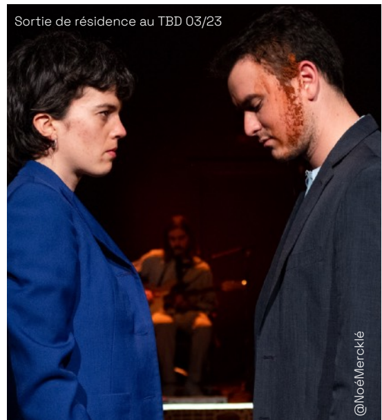
Sortie de résidence au TBD 03/23

Tout au long du spectacle les personnages endurent la scène dont ils gardent l'emprunte sur leurs vêtements et sur leurs corps.