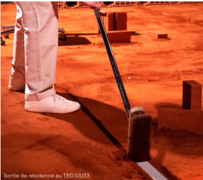
Sortie de résidence au TBD 03/23

La terre nous permet de suggérer un espace proche d'une arène, là où le spectacle et le combat se côtoient.